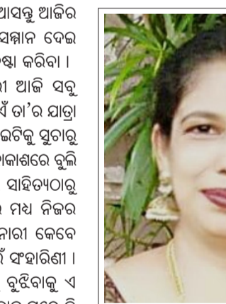
୧୯୧୦ ମସିହାରେ ୨୮ତମ ସମାଜତାତ୍ତ୍ୱିକ ଆନ୍ତର୍ଜାତିକ ସମ୍ମିଳନୀ କୋପେନ୍ ହେଗେନ୍ରେ ହୋଇଥିଲା। ଏଥିରେ ପୃଥିବୀର ସବୁଜାତୀୟ ମହିଳାଙ୍କୁ ଯୋଗ ଦେଇଥିଲେ। ସେଠାରେ ଗୋଟିଏ ଆନ୍ତର୍ଜାତିକ ଦିବସ ପାଳନ

ସବୁବେଳେ ଅସମାହିତ। ତେବେ ଆସନ୍ତୁ ଆଜିର ବିଶ୍ୱ ମହିଳା ଦିବସରେ ନାରୀକୁ ସମ୍ମାନ ଦେଇ ସାରା ବିଶ୍ୱର ମଙ୍ଗଳ କରିବାକୁ ଚେଷ୍ଟା କରିବା। କେବଳ ଏତିକି ନୁହେଁ ନାରୀ ଆଜି ସବୁ କ୍ଷେତ୍ରରେ ଧୂରାଣୀ। ଭୂମିରୁ ଭୂମାୟାଏଁ ତା’ର ଯାତ୍ରା ସଫଳ ହୋଇଛି। ଘରର ପ୍ରତିଟି ପାଲଟିକୁ ସୁତାରୁ ରୁପେ କରିବା ଠାରୁ ଆରମ୍ଭ କରି ମହାକାଶରେ ବୁଲି ଆସିଲାଣି ନାରୀ। ନୃତ୍ୟ, ସଙ୍ଗୀତ, ସାହିତ୍ୟଠାରୁ ଆରମ୍ଭ କରି ସେବା ଓ ସେନାରେ ମଧ୍ୟ ନିଜର ଦକ୍ଷତା ଦେଖାଇପାରିଛି ନାରୀ। ନାରୀ କେବେ ସ୍ୱେଦପମୟୀ କେବେ ପୁଣି ଶତ୍ରୁ ପାଇଁ ସଂହାରିଣୀ। ଏତେ ସବୁପରେ ବି ନାରୀକୁ ବୁଝିବାକୁ ଏ ସମାଜ ଅମଙ୍ଗ କାହିଁକି। ସବୁ ବଳିଦାନ ପରେ ବି ତା’ ଉପରେ ଏତେ ନିର୍ଯ୍ୟାତନା କାହିଁକି? ଏ ପ୍ରଶ୍ନ