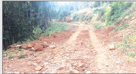
ରାଷ୍ଟ୍ରା ପାଇଁ ଠିକାଦାର ଯତ୍ନ ନେଇ ଅଧିକାରୀ ଠିକାଦାର ଫେରାର ହେବା ଯୋଗୁଁ ଗ୍ରାମବାସୀ ଅସୁବିଧାରେ ପୀଡ଼ିତ ହେଉଛନ୍ତି ।

ଫିରିଙ୍ଗିଆ, ୨୭/୦୪(ମନୋଜ ସାହୁ) ରାଜ୍ୟ ଓ କେନ୍ଦ୍ର ସରକାର ଶହରାଞ୍ଚଳଠାରୁ ଗ୍ରାମାଞ୍ଚଳ ମାନଙ୍କର ସଂଯୋଗକରଣ ଓ ଉପାଦାନ ଅଞ୍ଚଳ ମାନଙ୍କରେ ଯାତାୟତର ସୁବିଧା ପାଇଁ ରାଜକୋଷରୁ କୋଟିକୋଟି ଟଙ୍କା ବ୍ୟୟବ୍ୟୟ କରି ପ୍ରଧାନମନ୍ତ୍ରୀ ଗ୍ରାମ୍ୟ ସଡ଼କ ଯୋଜନା ଅଧୀନରେ ପଲ୍ଲୀ ସଡ଼କ ନିର୍ମାଣ କରିବାକୁ ଲାଗିଛନ୍ତି । କିନ୍ତୁ କିଛି ଜାଗାରେ କିଛି ବିଭାଗୀୟ ଅଧିକାରୀ ଏହି ରାଷ୍ଟ୍ରା ନିର୍ମାଣର ଦାୟିତ୍ୱ