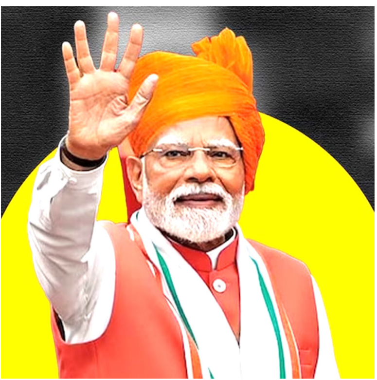
ପାଇଁ ମୋଦୀଙ୍କୁ ଶ୍ରଦ୍ଧା ଜଣାଇଛି। ମୋଦୀଙ୍କ ନେତୃତ୍ୱରେ ଭାରତ ଶକ୍ତିଶାଳୀ ଦେଶ ଭାବେ ଉଭା ହୋଇଛି। ଲଗାତାର ତିନି ଥର ନେତୃତ୍ୱ ନେବା ଗୌରବର କଥା। ସେହିପରି ଆମେରିକା ସିନେଟର ଜନ୍ କାର୍ଣ୍ଣି ମଧ୍ୟ ମୋଦୀଙ୍କୁ ଶ୍ରଦ୍ଧା ଜଣାଇଛନ୍ତି। ସେ କହିଛନ୍ତି ଯେ, ମୋଦୀ ୪୩୯୯ ଦିନ ଧରି କାର୍ଯ୍ୟକାଳ ସମାପ୍ତ କରିଛନ୍ତି। ଏହା ୧୪୦ କୋଟି ଭାରତୀୟଙ୍କର ଭରସା ଉପରେ ଆଧାରିତ। ଭାରତ ଏବେ ବିଶ୍ୱର ସବୁଠାରୁ ଦ୍ରୁତ ଗତିରେ ଆଗକୁ ବଢୁଥିବା ଆର୍ଥିକବସ୍ତୁ ହୋଇପାରିଛି ବୋଲି ସେ ପ୍ରକାଶ କରିଛନ୍ତି।

ନୂଆଦିଲ୍ଲୀ, ୧୦।୬: ପ୍ରଧାନମନ୍ତ୍ରୀ ନରେନ୍ଦ୍ର ମୋଦୀ ଏକ ବଡ଼ ଉପଲବ୍ଧି ହାସଲ କରିଛନ୍ତି। ସେ ଦେଶର ସର୍ବାଧିକ ସମୟ ଧରି ନିର୍ବାଚିତ ପ୍ରଧାନମନ୍ତ୍ରୀ ହୋଇଛନ୍ତି। ଏହି ବଡ଼ ଉପଲବ୍ଧି ପାଇଁ ମୋଦୀଙ୍କ ନେତୃତ୍ୱକୁ ସବୁଆଡ଼ୁ ଶ୍ରଦ୍ଧା ମିଳୁଛି। ବିଶ୍ୱର ବଡ଼ ବଡ଼ ନେତା ଯିଏମ୍‌ଙ୍କୁ ଶ୍ରଦ୍ଧା ଜଣାଉଛନ୍ତି। ତାଙ୍କର ବିଚାରଧାରାକୁ ଅନେକ ଦେଶ ପ୍ରଶଂସା ମଧ୍ୟ କରୁଛି। ଖାସ୍ କରି ଲୁଗାଲ ଯାଉଥିବା ମୋଦୀଙ୍କ ନୀତି ସବୁଠୁ ଗୁରୁତ୍ୱପୂର୍ଣ୍ଣ ସାଧ୍ୟତା ହୋଇଛି। ପିଏମ୍ ମୋଦୀଙ୍କ ସତରଠ ଉପଲବ୍ଧିକୁ ନେଇ ଶ୍ରୀଲଙ୍କା ରାଷ୍ଟ୍ରପତି ଅନୁରା କୁମାରା ଦିସାନାୟକେ ପତ୍ର ଲେଖି ଶ୍ରଦ୍ଧା ଜଣାଇଛନ୍ତି। ସେ ଲେଖିଛନ୍ତି ଯେ, ମୋଦୀ ଏହିତ୍ରାସିକ ସଫଳତା ପାଇଛନ୍ତି। ବିଶ୍ୱର ସର୍ବବୃହତ ଗଣତନ୍ତ୍ର ଦ୍ୱାରା ସେ ବାରମ୍ବାର ନିର୍ବାଚିତ ହୋଇଛନ୍ତି। ଜନତା ତାଙ୍କ ଉପରେ ଅତୁଟ ଭରସା ରଖନ୍ତି। ଭାରତରେ ଅନେକ ସାମାଜିକ ଏବଂ ଆର୍ଥିକ ସୁଧାର ଆସିଛି। ପ୍ରଶାନ୍ତ ମହାସାଗରୀୟ ଦେଶ ପଞ୍ଚାୟା ନ୍ୟୁ ସିନିର ପ୍ରଧାନମନ୍ତ୍ରୀ କେମ୍‌ସ୍ ମାଭାପେ ମୋଦୀଙ୍କ ପାଇଁ ଭିଡିଓ ମେସେଜ୍ ଜାରି କରିଛନ୍ତି। ସେ ମୋଦୀଙ୍କୁ ବିଶ୍ୱର ଜଣେ ମହାନ ଲୋକ ମତେଇ ବୋଲି କହିଛନ୍ତି। ତାଙ୍କ ନେତୃତ୍ୱର ଉଦ୍‌ଘୋଷଣା ମଧ୍ୟ ଦେଇଛନ୍ତି। ଆହୁରି ପ୍ରଶଂସା କରିଛନ୍ତି ଯେ, ମୋଦୀ ସରକାର ଭାରତରେ ୨୦ କୋଟିରୁ ଅଧିକ ଲୋକଙ୍କୁ ଦାରିଦ୍ର୍ୟ ଯାମା ରେଖାରୁ ବାହାର କରିଛନ୍ତି। ଏହା ଏକ ଚମତ୍କାର ଉପଲବ୍ଧି ଅଟେ। ତ୍ରିନିଦାଦ ଏବଂ ଡୋମିନିକା ପିଏମ୍ କମଳା ପ୍ରସାଦ- ବିସେସର କହିଛନ୍ତି ଯେ, ଏହିତ୍ରାସିକ ସଫଳତା